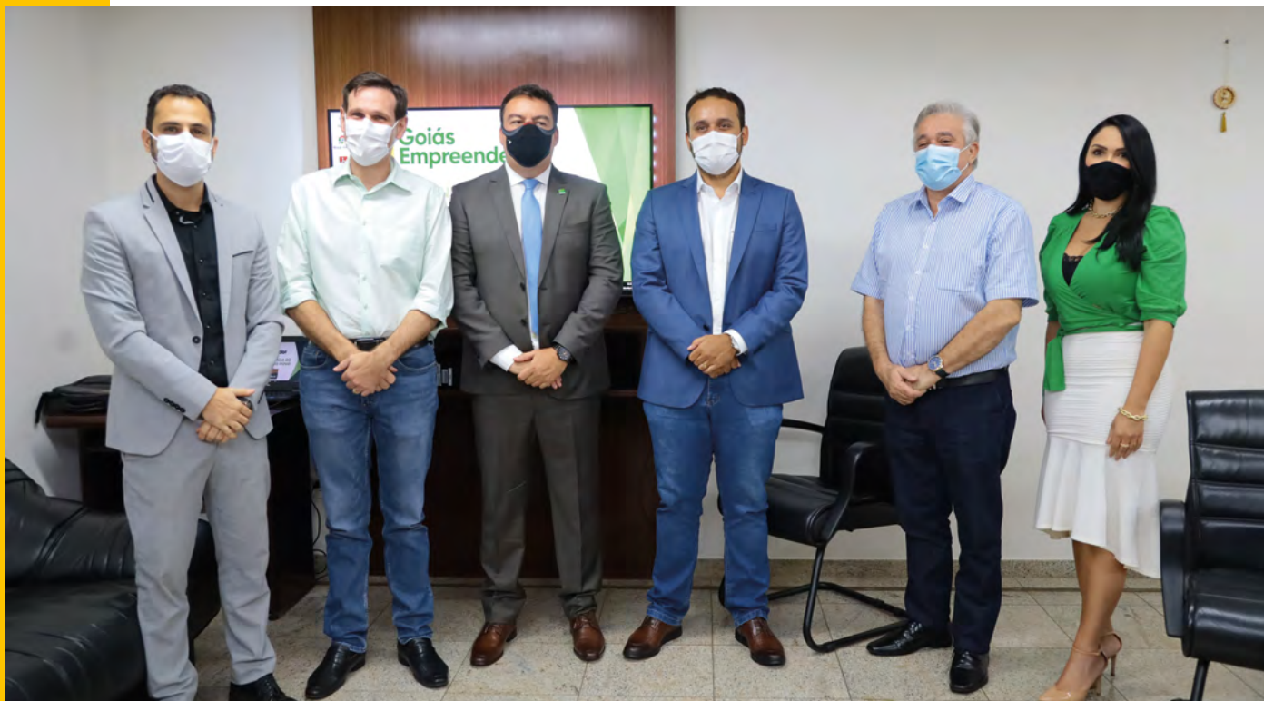
Reunião de apresentação do projeto na Secretaria de Indústria e Comércio (SIC).