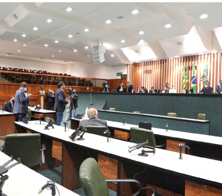
Reunião da CCJ.

Quando se trata de projetos da Governadoria, estes só vão para a CCJ quando recebem emendas em Plenário. Isso ocorre porque o projeto que vem do Governo é analisado pela Comissão Mista.