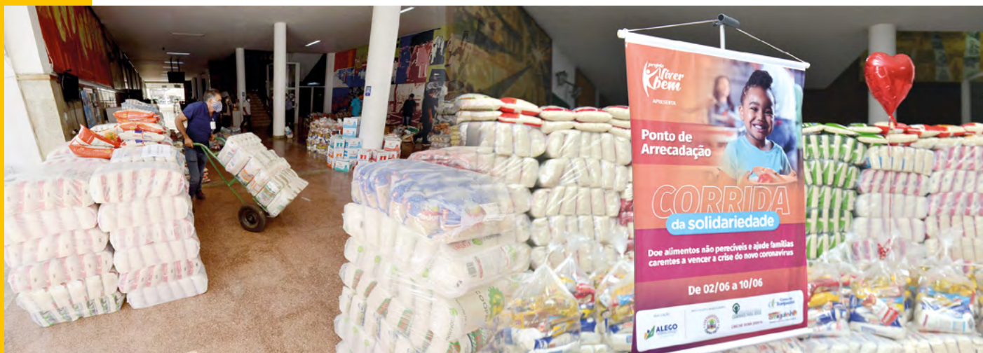
Alimentos arrecadados na Corrida da Solidariedade de 2020.