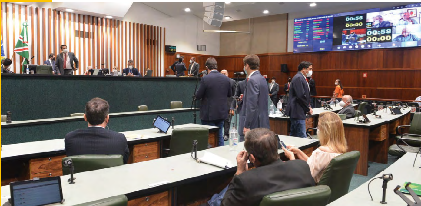
Reunião da CCJ no Plenário da Alego.