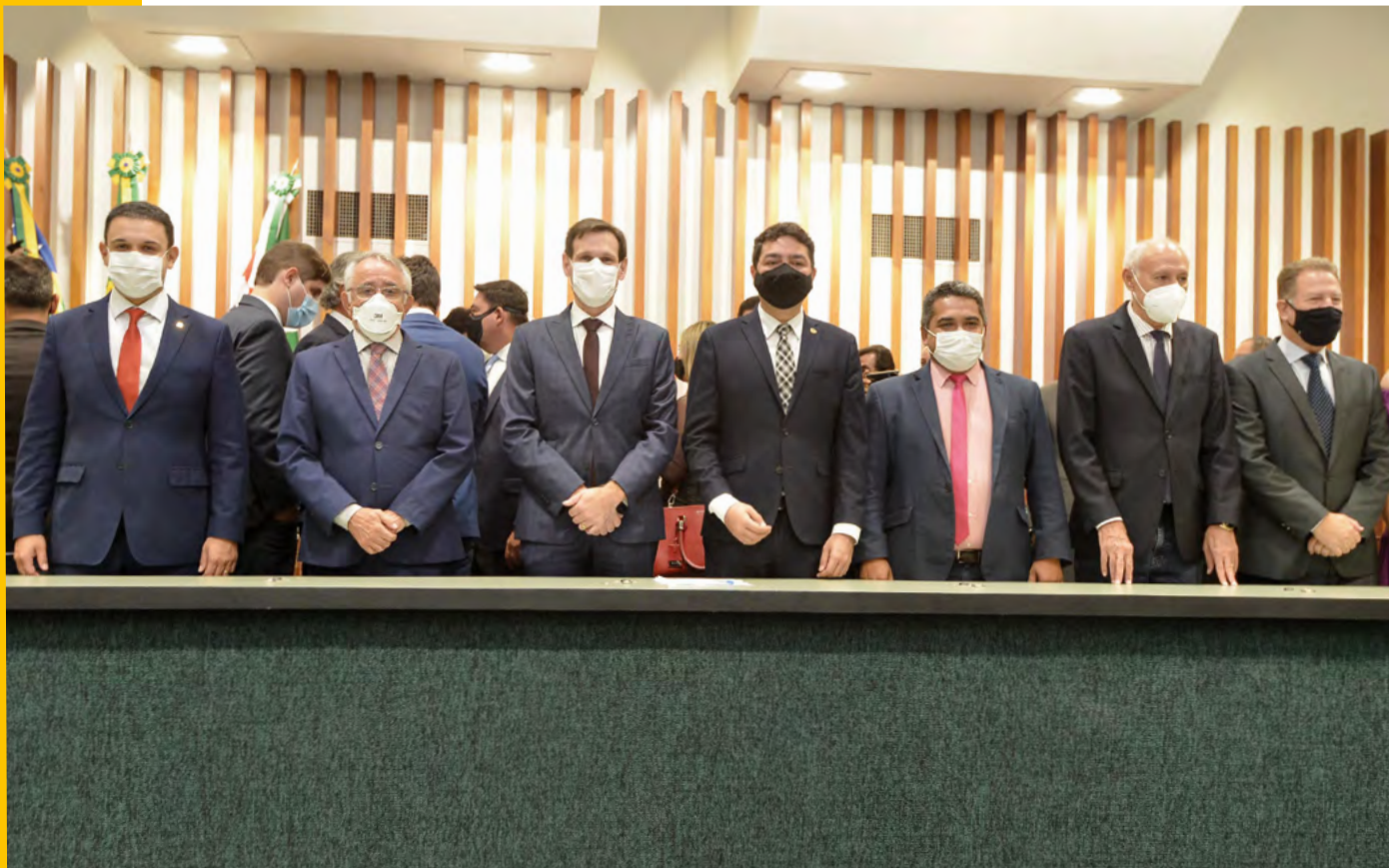
Eleição da Mesa Diretora do Biênio 2021/2022.