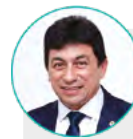
Chico KGL (DEM) Gabinete 36

☎ (62) 3221-3207 / 3229 📷 @deputadocharlesbento 📌 Deputado Charles Bento ✉ charlesbento@al.go.leg.br