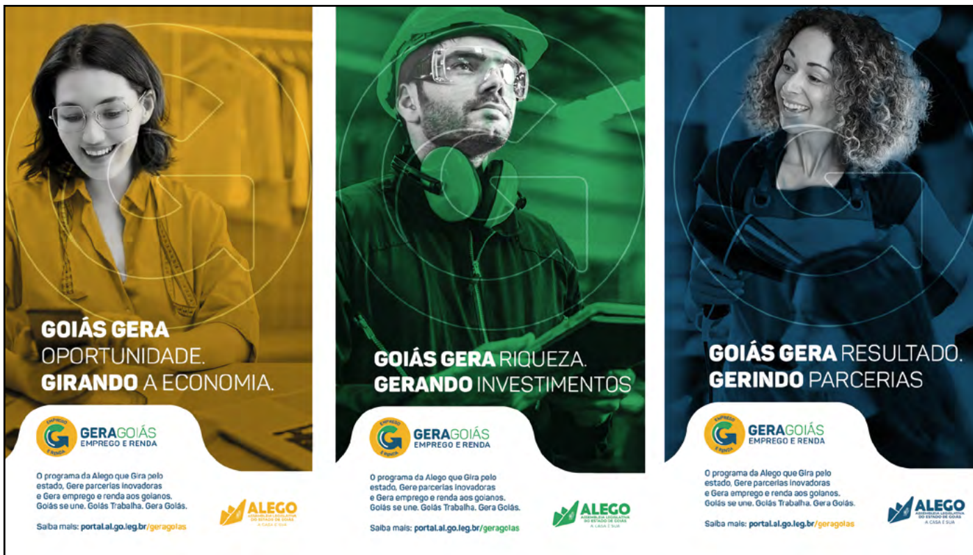
Campanha publicitária para o projeto Gera Goiás